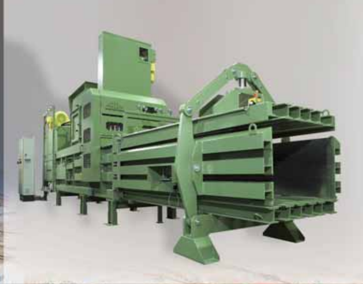
channel baling presses